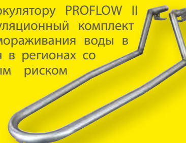
Арт. A-397 Циркуляционный комплект

Подсоединенный к циркулятору PROFLOW II или SPEED-FLOW, циркуляционный комплект позволяет избежать замораживания воды в баке. Он рекомендуется в регионах со слабым или умеренным риском замерзания.